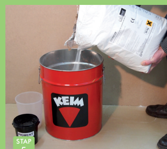
STAP 5 Inhoud van zak volledig in kuip storten.