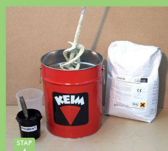
STAP 4 Poeder goed, en volledig door mengen.