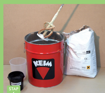
STAP 6 Geheel homogeen door mengen en resterend water toevoegen.