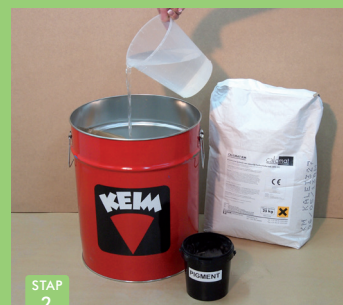
STAP 2 Twee-derde van aanmaakwater in kuip gieten.