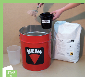
STAP 3 Inhoud van pigmentpotje toevoegen.