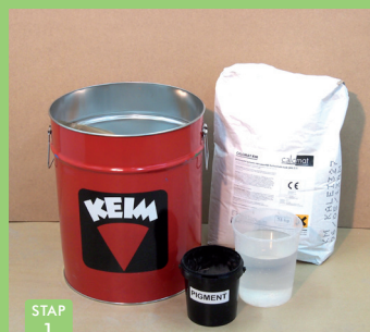
STAP 1 Zak kaleimortel, pigmentpotje en water klaar zetten.