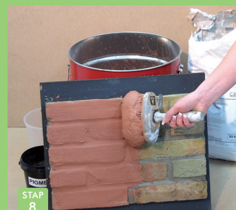
STAP 8 Kaleimortel aanbrengen.