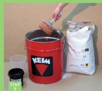
STAP 7 Mengen tot kwastbare consistentie.